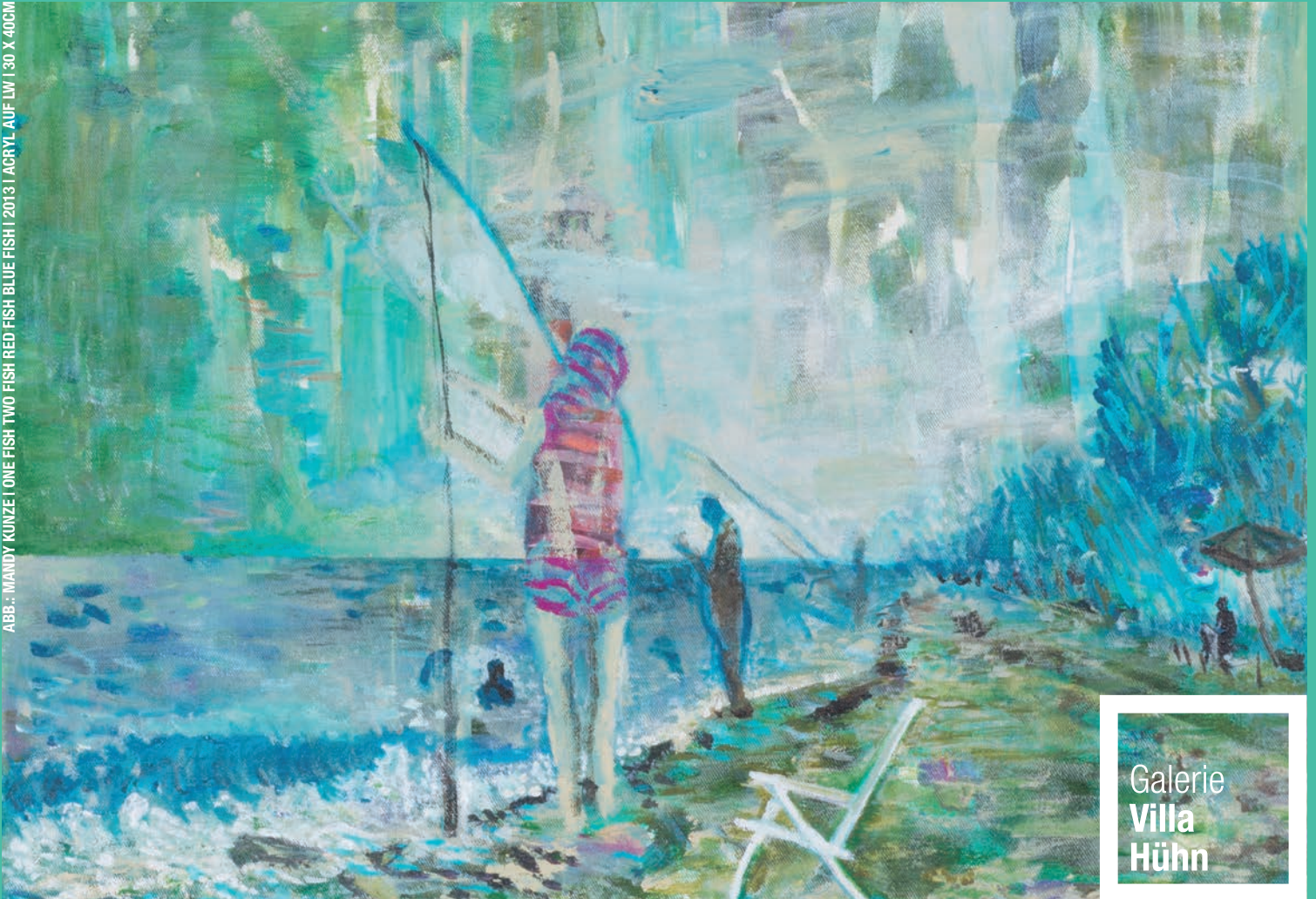
ABB.: MANDY KUNZE | ONE FISH TWO FISH RED FISH BLUE FISH | 2013 | ACRYL AUF LW | 30 X 40CM